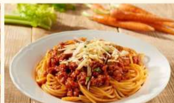
MASSAS COM MOLHO